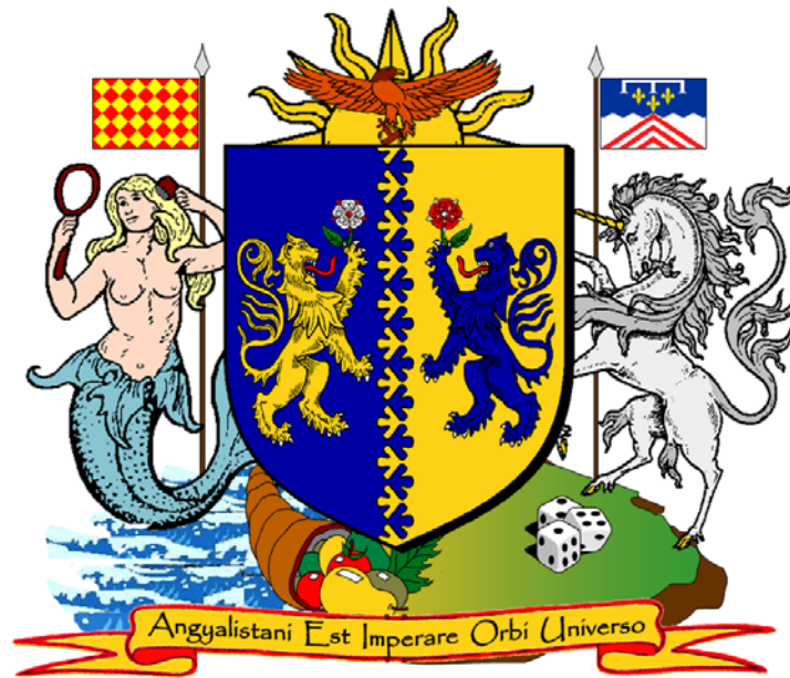
Grandes Armoiries de l'Empire d'Angyalistan